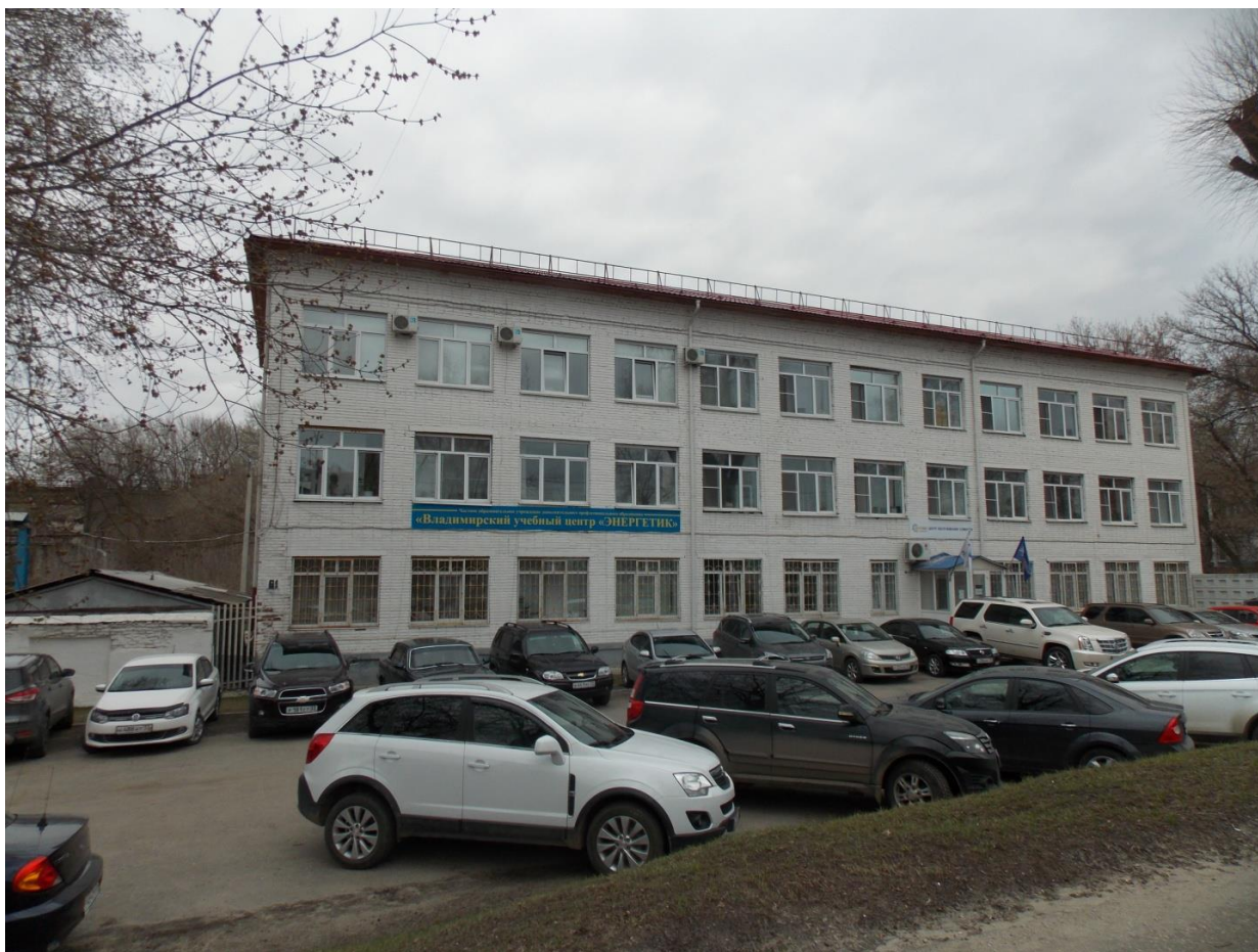
Здание учебного центра (г. Владимир, ул. Большая Нижегородская, д. 81).

Уникальность и характерная особенность учебного центра, в первую очередь, определяется тем, что он работает в теснейшем контакте и в интересах важнейшего предприятия области – филиала "Владимирэнерго". Это не случайно, поскольку свою историю Владимирский учебный центр ведет от учебно-курсового пункта для подготовки кадров в электроэнергетике и повышения их квалификации, образованного в 1990 году в структуре "Владимирэнерго". Учебный центр "Энергетик" и "Владимирэнерго" связывают уже более двадцати восьми лет теснейшие многообразные связи.