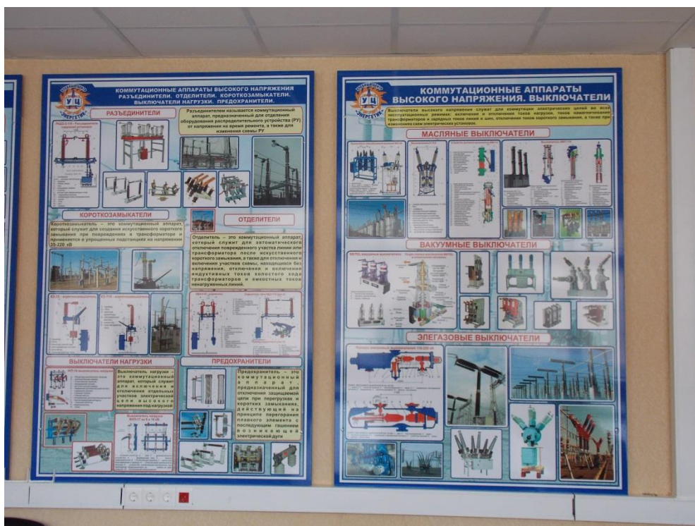
В учебном центре теоретические сведения, иллюстрируются плакатами и реальными наглядными пособиями

Одной из "фирменных" особенностей учебного центра, обеспечивающей выполнение требования стандартов качества обучения, является обязательный двух ступенчатый выходной контроль знаний слушателей. Такой контроль в форме итоговой аттестации предполагает тестирование каждого слушателя на ПЭВМ с помощью компьютерных программ обучения и контроля «Олимп-ОКС», «Асоп-эксперт» и некоторых других, после чего аттестуемый сдает устный экзамен квалификационной комиссии, в состав которой в обязательном порядке входят специалисты-эксперты с предприятия заказчика или профильных организаций.